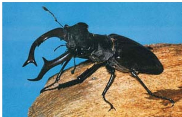
Totholz ist für die Entwicklung der Larven des Hirschkäfers unabdingbar

Bei der Auswahl von Habitatbäumen ist auf die Dimensionen zu achten: Für viele Tot- und Altholzbewohner ist Starkholz über 50 cm BHD unverzichtbar. Zusätzlich muss das Netzwerk Waldbestände beinhalten, in denen schon länger ein kontinuierliches Alt- und Totholzangebot verfügbar war (ehemalige Weide-, Mittel- und Plenterwälder). Derartige Waldbestände beherbergen eine ausreichend breite Palette anspruchsvoller Totholz-organismen, die das Netzwerk besiedeln und nutzen können. Waldrefugien sollten bevorzugt im Bereich solcher Altbestände angelegt werden.