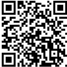
(QR-Code „Waldpflege, als Aufkleber auf allen Tafeln ab 2013)

Diese Maßnahmen werden innerhalb des jeweiligen Durchführungszeitraumes auch auf der Homepage unter www.essen.de Stichwort "Waldpflege" allgemein vorgehalten. Weitere Informationen auch unter: www.gruen-und-gruga.de .