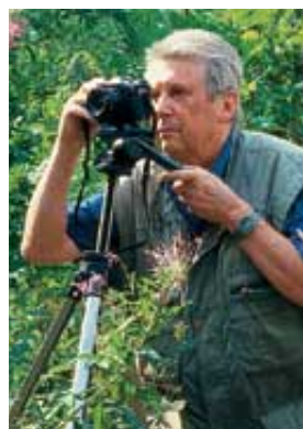
Forstexperte Meister „Waldsterben von unten“

Meister: Seit meiner Pensionierung ist der Wildbestand offenbar wieder stark angestiegen, und das wird wieder zu stärkerem Verbiss führen. Wie mächtig die Jagdlobby ist, erleben wir auch gerade in anderen Gebirgen oder in Brandenburg. Einige staatliche Förster, die dort den Mut haben, das Wild auf ein waldverträgliches Maß zu verringern, werden von den Jagdfunktionären massiv unter Druck gesetzt. So wird der Waldumbau zum Schutz von Mensch und Natur verhindert.