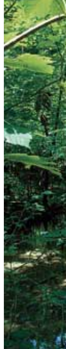
Entstehung eines naturnahen Auwaldes in Bad Reichenhall (1982, 1983, 2001)*: „Die meisten Förster können sich nicht vorstellen, wie schnell